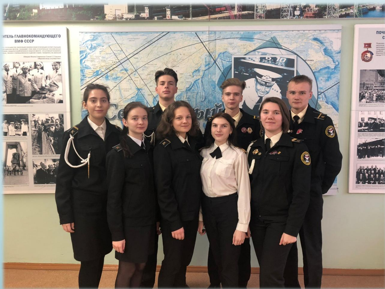
Лидеры экологического отряда «Green Team»

«Только мы в ответе за Землю, которая останется нашим детям!»