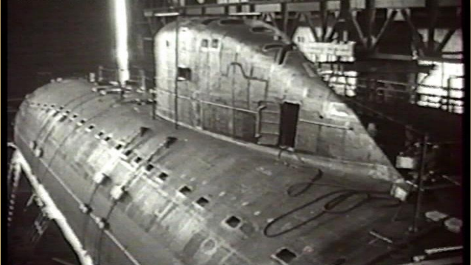
«Ленинский комсомол» Атомная подводная лодка проекта 627 в цехе судостроительного завода № 402.