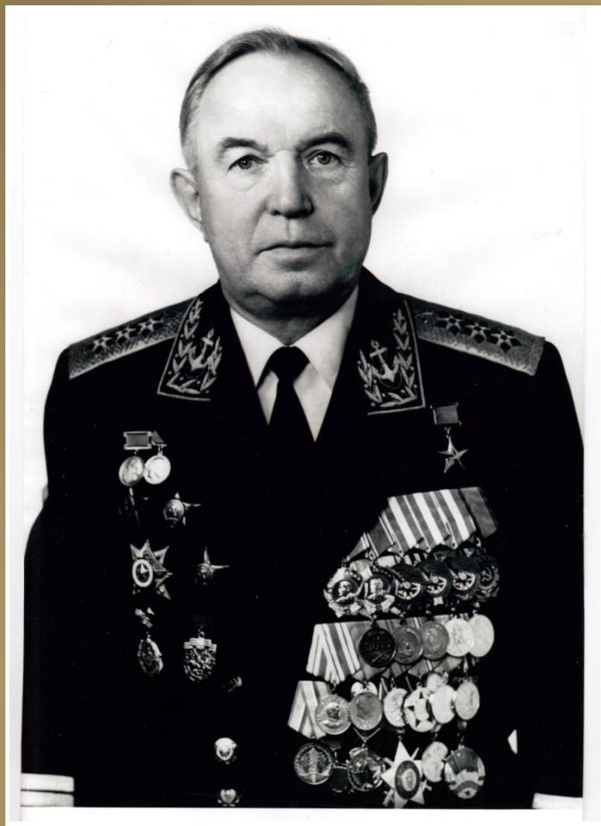
П.Г. Котов 3 января 1911г. 12 января 2007г. (96 лет)

Герой Социалистического Труда, заместитель главнокомандующего ВМФ СССР по кораблестроению и вооружению – начальник кораблестроения и вооружения ВМФ СССР, адмирал, почетный гражданин г. Северодвинска.