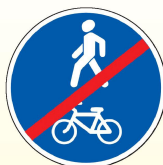
4.5.3. «Конец пешеходной и велосипедной дорожки с совмещенным движением»