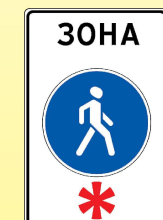
5.33 «Пешеходная зона»