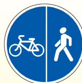
4.5.4. «Пешеходная и велосипедная дорожки с разделением движения»