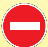
3.1 «Въезд запрещён»