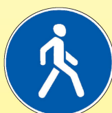
4.5.1 «Пешеходная дорожка»