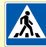
5.19.1. «Пешеходный переход»