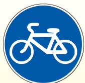
4.4.1. «Велосипедная дорожка»