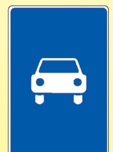
5.3 «Дорога для автомобилей»