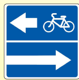
5.13.3. «Выезд на дорогу с полосой для велосипедистов»