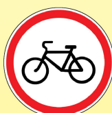
3.9 «Движение на велосипедах запрещено»