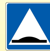
5.20. «Искусственная неровность»