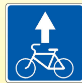
5.14.2. «Полоса для велосипедистов»