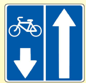
5.11.2. «Дорога с полосой для велосипедистов»