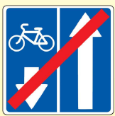
5.12.2. «Конец дороги с полосой для велосипедистов»