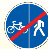
4.5.6. «Конец пешеходной и велосипедной дорожки с разделением движения (конец велопешеходной дорожки с разделением движения)»