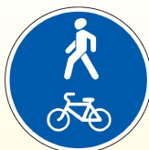
4.5.2. «Пешеходная и велосипедная дорожка с совмещенным движением (велопешеходная дорожка с совмещенным движением)»