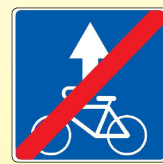
5.14.3. «Конец полосы для велосипедистов»