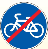
4.4.2. «Конец велосипедной дорожки или полосы для велосипедистов»