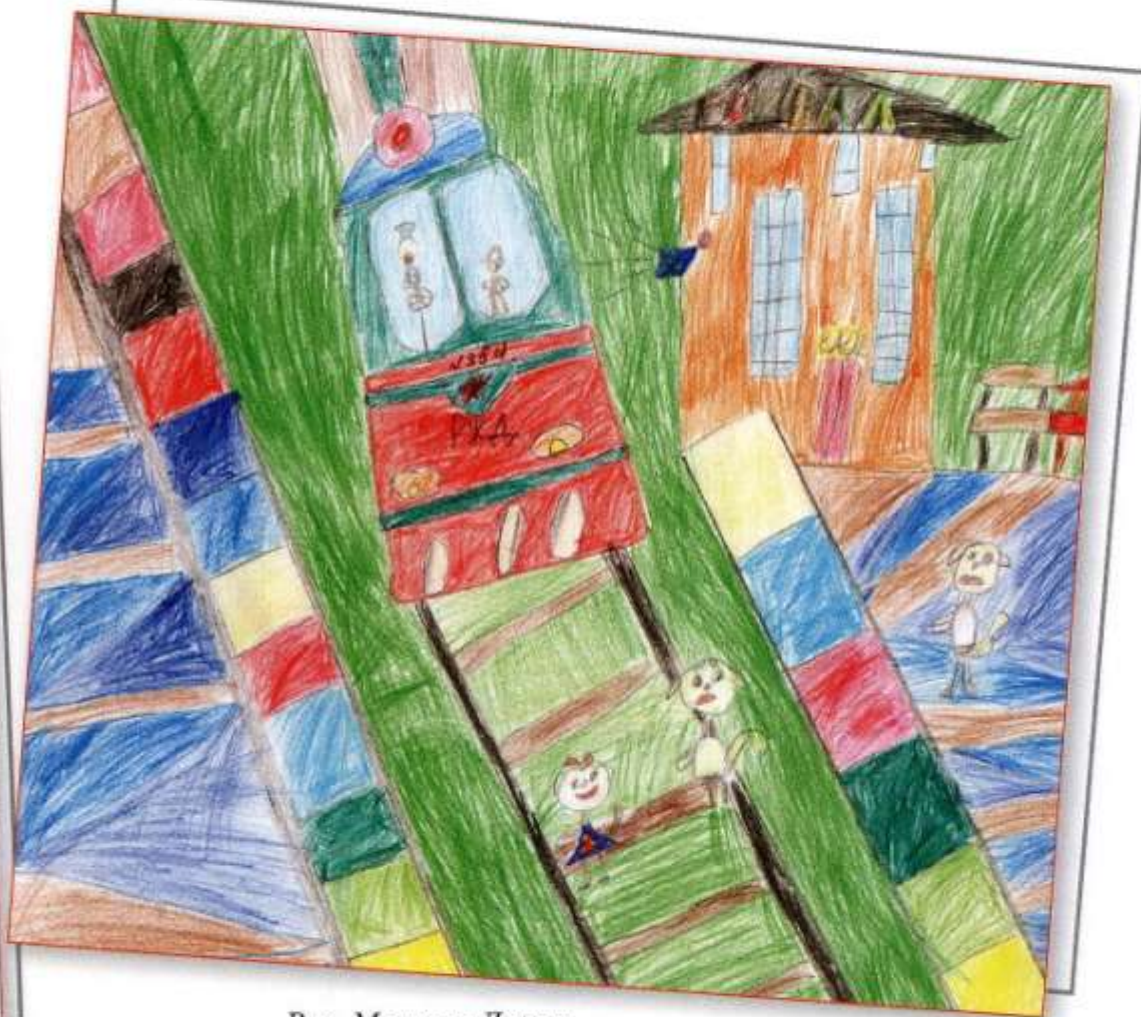
Рис. Маслова Дарья, НОУ «Школа-интернат № 23 ОАО «РЖД»