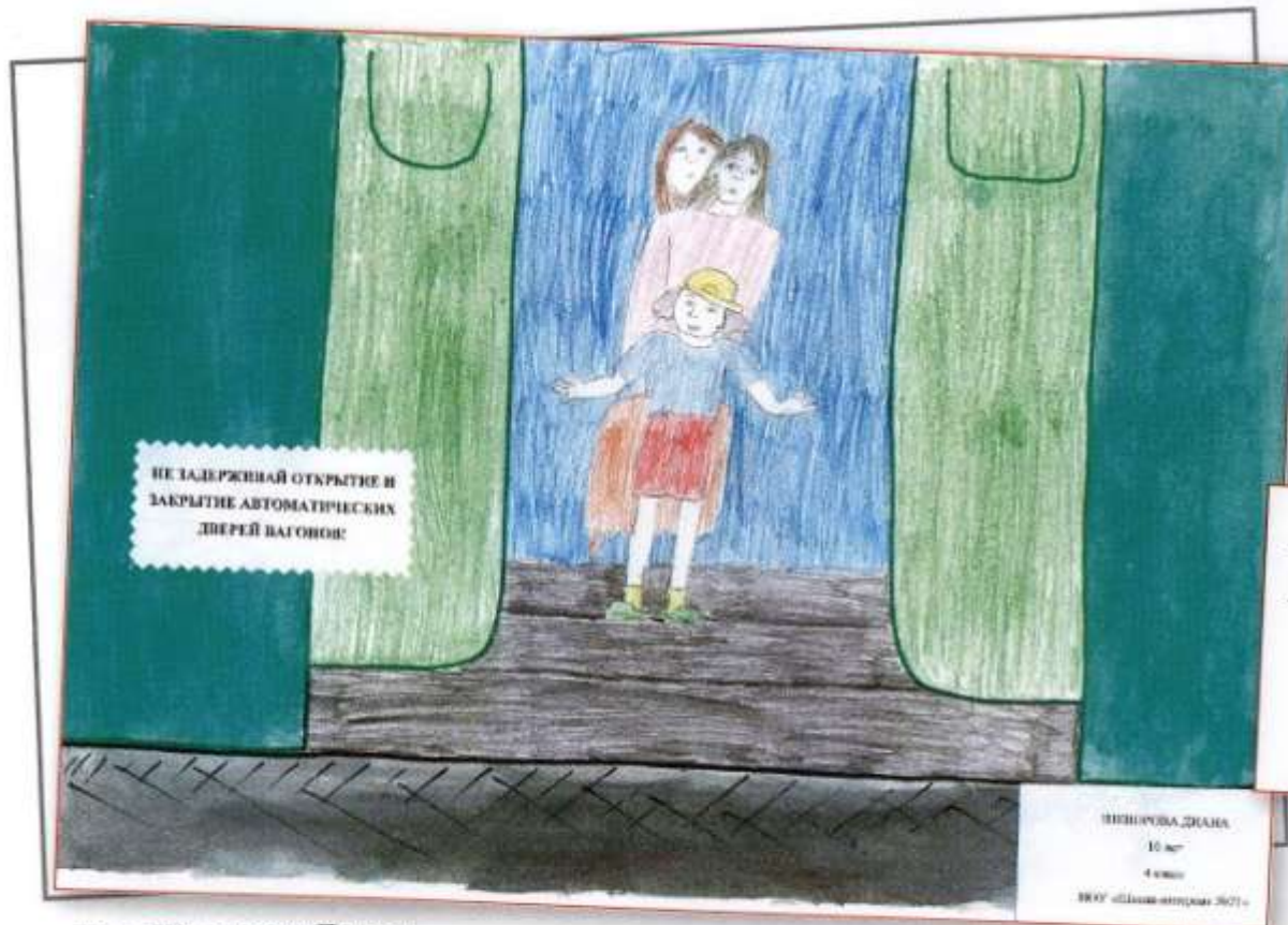
Рис. Шкворова Диана, НОУ «Школа-интернат № 21 ОАО «РЖД»

Не подходи к вагонам до полной остановки! Не прислоняйся к стоящим вагонам! Не пытайся попасть в вагон или выйти во время движения! Не стой на подножках!