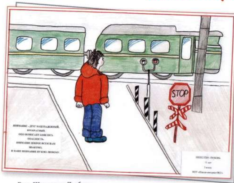
Рис. Шевелева Любовь, НОУ «Школа-интернат № 21 ОАО «РЖД»