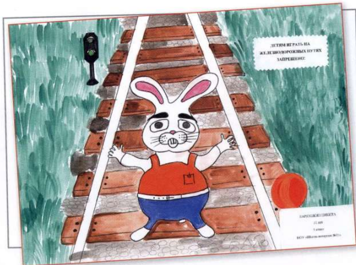
Рис. Ларюшкин Никита, НОУ «Школа-интернат № 21 ОАО «РЖД»

Мчится поезд, обгоняя ветер: – Не играйте на дороге, дети!